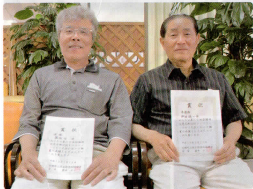
個人の上位入賞者